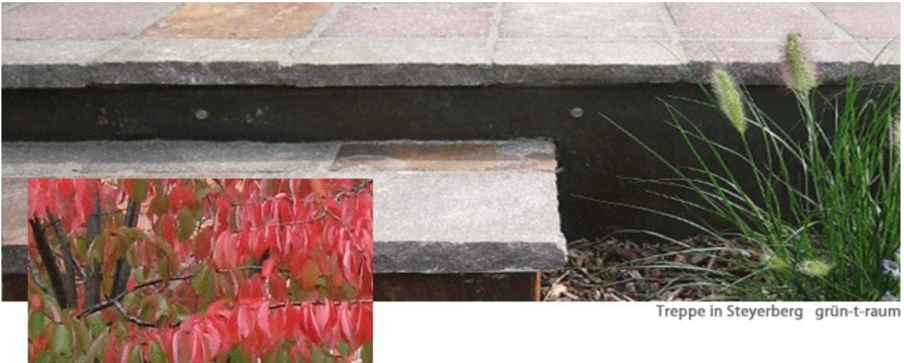
Treppe in Steyerberg grün-t-raum