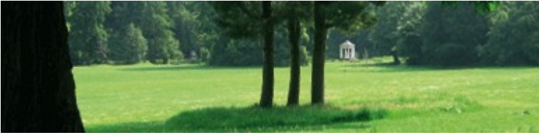
Blickachse im Schlosspark Tiefurt

Die Stadt ist geprägt durch alte und neue Kulturgeschichte: Goethe, Schiller, das Bauhaus ... um nur einige zu nennen. Drei große Parkanlagen verbinden Stadt und Landschaft, im Stil der englischen Landschaftsparks.