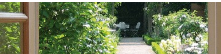
Blickachse im Kirms-Krackow-Garten

Aber auch innerhalb der Altstadt gibt es schöne Gartenoasen und ein Meer aus Blüten zu entdecken.