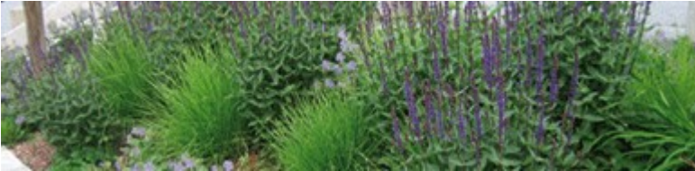
Staudenbeete am Wielandplatz

Die Stadt ist geprägt durch alte und neue Kulturgeschichte: Goethe, Schiller, das Bauhaus ... um nur einige zu nennen. Drei große Parkanlagen verbinden Stadt und Landschaft, im Stil der englischen Landschaftsparks.