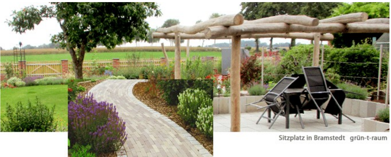
Sitzplatz in Bramstedt grün-t-raum