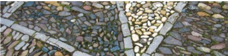
Pflaster aus Flusskies vor Goethes Gartenhaus

Aber auch innerhalb der Altstadt gibt es schöne Gartenoasen und ein Meer aus Blüten zu entdecken.