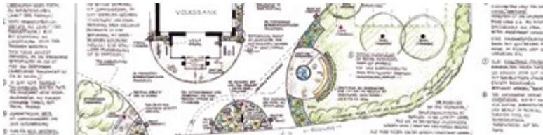
Entwurf in 1:100

Die Gestaltungsideen wurden in einem detaillierten Entwurf konkretisiert.