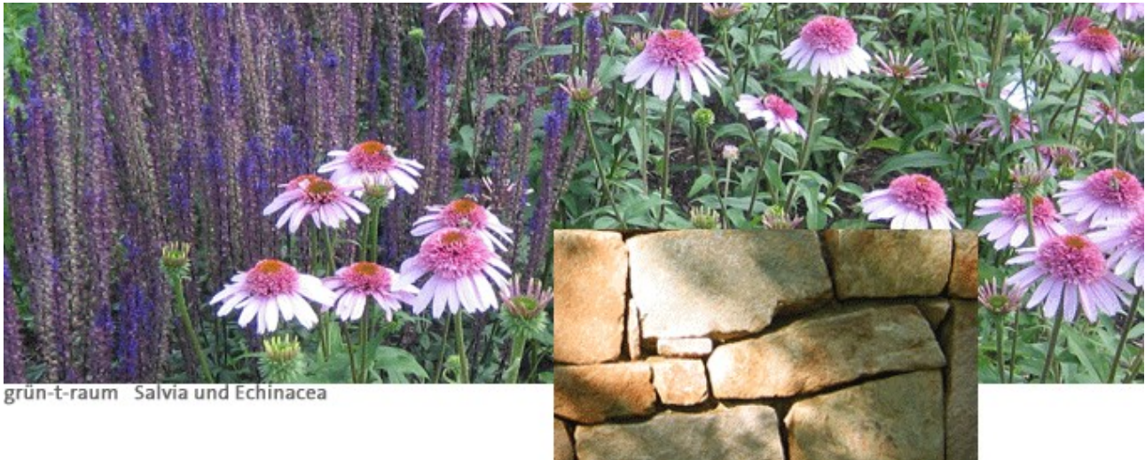
grün-t-raum Salvia und Echinacea