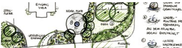
Vorentwurf B in 1:200

Die Gestaltungsideen wurden in einem detaillierten Entwurf konkretisiert.