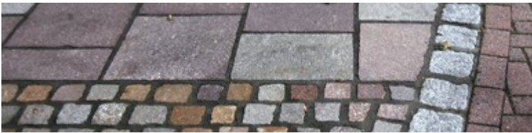
Pflasterdetail im Eingangsbereich aus Porphyry

Im Zuge des Gebäudeumbaus der Volksbankfiliale, durch die Architektin Astrid Greve aus Twistringen, wurde ich gebeten eine Neugestaltung des Vorplatzes zu planen. In ersten Vorentwürfen wurden 2013 verschiedene Varianten abgestimmt.