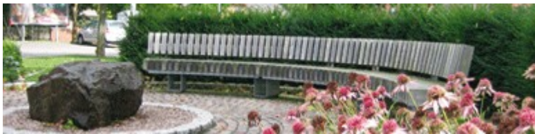
zentrale Klönbank mit Wasserspiel