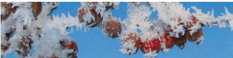
Zierapfel im Raureifkleid

Ende Februar ist eine gute Zeit vor dem Austrieb die letzten kräftigen Rückschnitte an Bäumen und Sträuchern im Garten vor zu nehmen, wenn uns nicht gerade verwunschene Winterlandschaften umgeben, wie in den obigen Fotos.