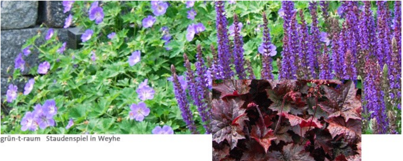
grün-t-raum Staudenspiel in Weyhe