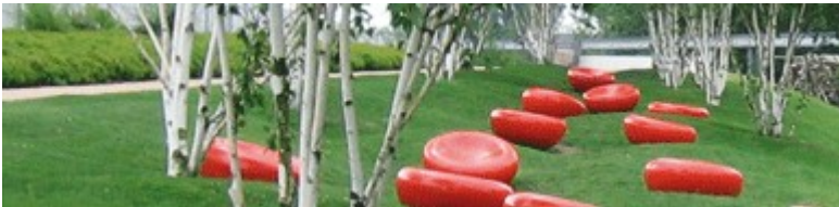
im Puls der Ruhe

Die jährliche Fachexkursion, zusammen mit meiner Berufskollegin, hat uns in diesem Jahr auf die IGS nach Hamburg geführt. Der Besuch war inspirierend - in vielerlei Hinsicht - und ist als kleiner Urlaub aus dem Alltag wirklich zu empfehlen.