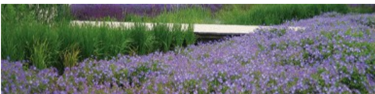
fließende Blütenwolken mit 'Rozanne' & Co.